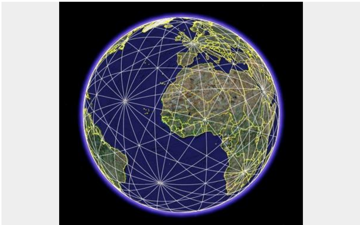
Leylijnen rondom de Aarde